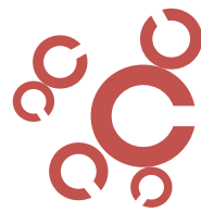
Scuola di Architettura di Cagliari