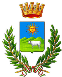
Comune di Nuoro